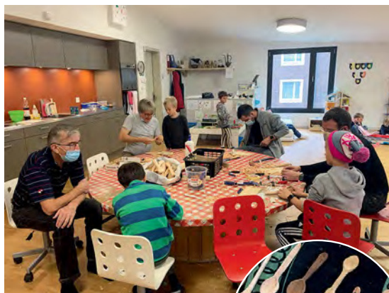
Vom Zauberstab bis zum selbst geschnitzten Holzlöffel, das Reka-Angebot für Kinder ist fantastisch