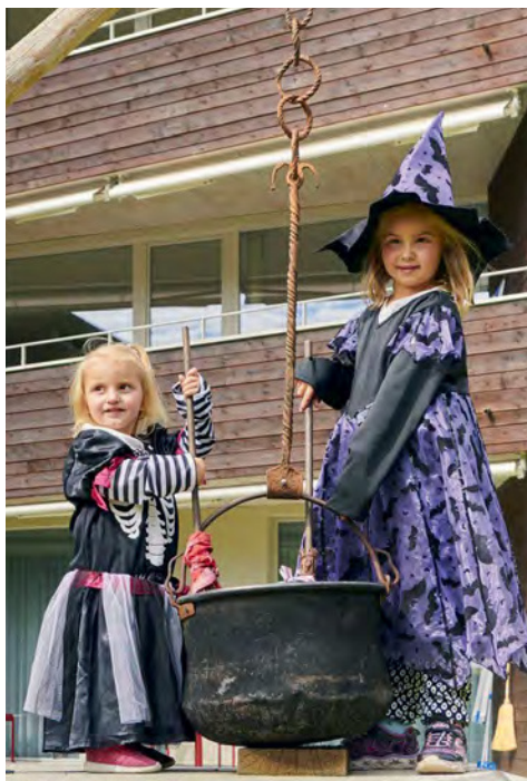
Hier können kleine Nachwuchshexen stilvoll im Hexenkessel kochen

Wandern, klettern und biken – die WALLISER ALPEN bieten unzählige Aktivitäten für einen abwechslungsreichen Familienurlaub. Zwei Hamburger Familien auf Tour durch die Schweizer Bergwelt rund ums Reka-Feriendorf