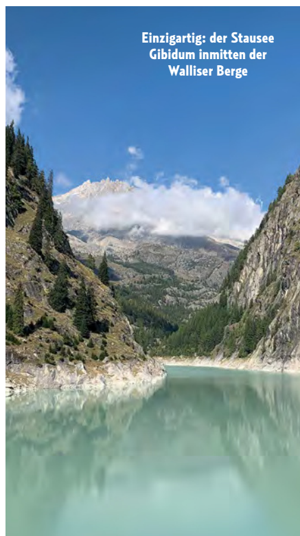
Einzigartig: der Stausee Gibidum inmitten der Walliser Berge

Am ersten Morgen beschert uns der große Balkon der Ferienwohnung einen atemberaubenden Ausblick auf die Walliser Alpen. Blatten-Belalp stellt sich als perfekter Ausgangspunkt zu unzähligen Aktivitäten heraus: Wandern, Bergsteigen, Biken und vieles mehr. Dabei begleitet die „Dorf-Häx“