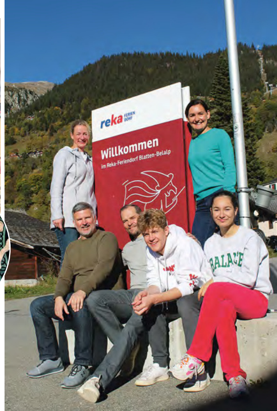
Mit vier Erwachsenen und zwei Teens genossen wir unseren Urlaub im wunderschönen Wallis