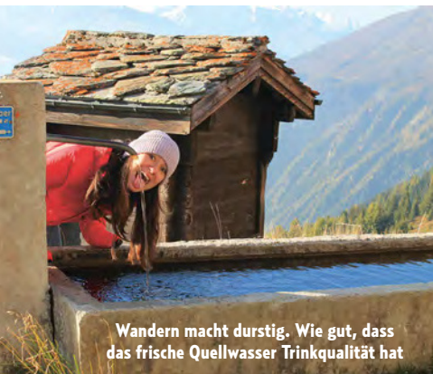
Wandern macht durstig. Wie gut, dass das frische Quellwasser Trinkqualität hat